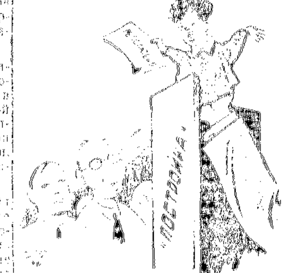
...О нем говорят... или о противнике...

В электрозаводской литкружке воспитание рабочих ударников является важнейшим делом. Но в этой литкружке много лжеударников, „трепачи“ и говоряшки. Они не понимают, что такое ударничество, и только хотят выделиться среди других. Они не понимают, что такое ударничество, и только хотят выделиться среди других.